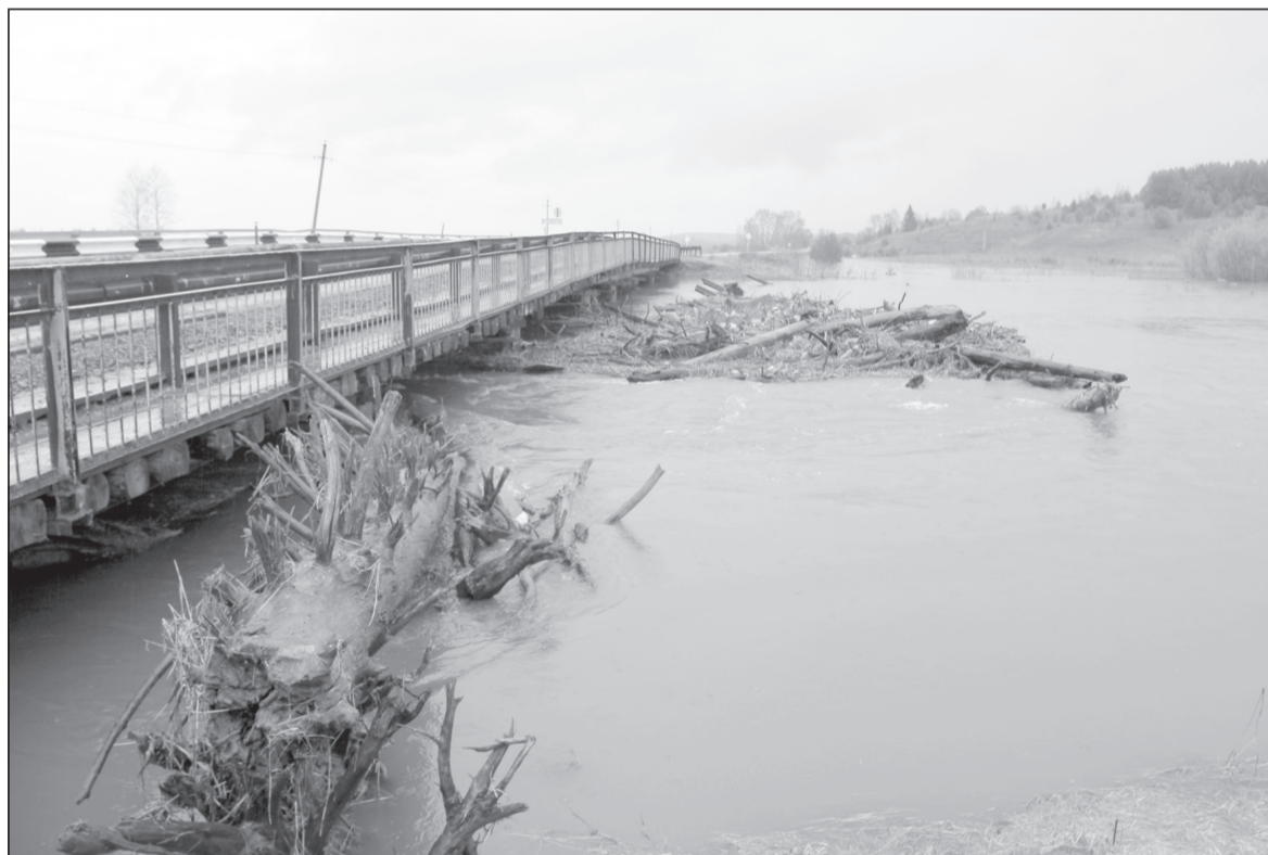
В апреле 2016 года вода разлилась так, что вплотную подошла к дороге у моста через Ирень около деревни Межовки. Стволы деревьев, принесенные водой, доставали тракторами.

Придет ли паводок в район зависит от погоды