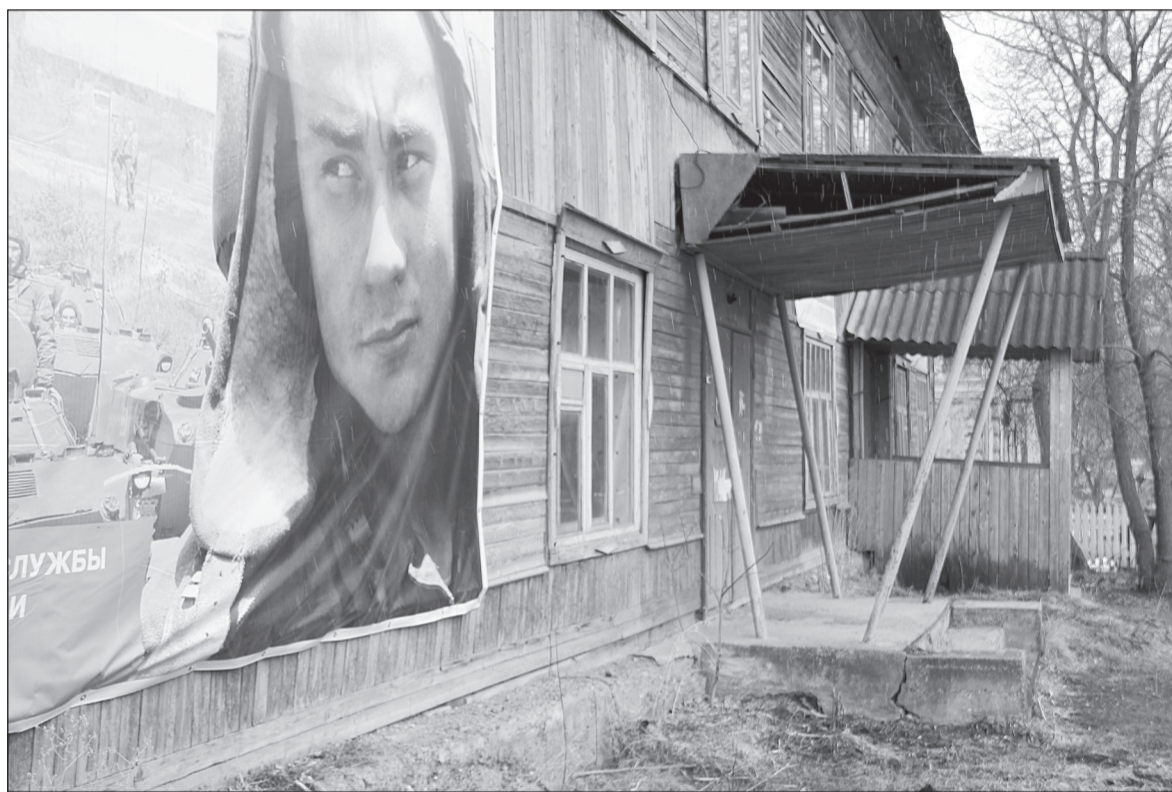
Здание, где находился военкомат, снесут. Что построить на его месте, - спросят у жителей.

Старое здание военкомата в будущем снесут. Район оформляет имущество в собственность