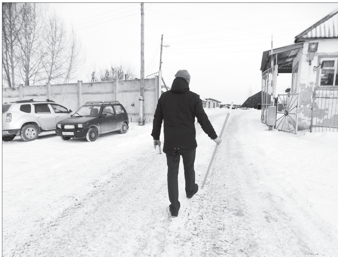
На территории предприятия «Теплоплюс» в Орде оборудовано специальное место для сбора использованных ртутьсодержащих ламп.