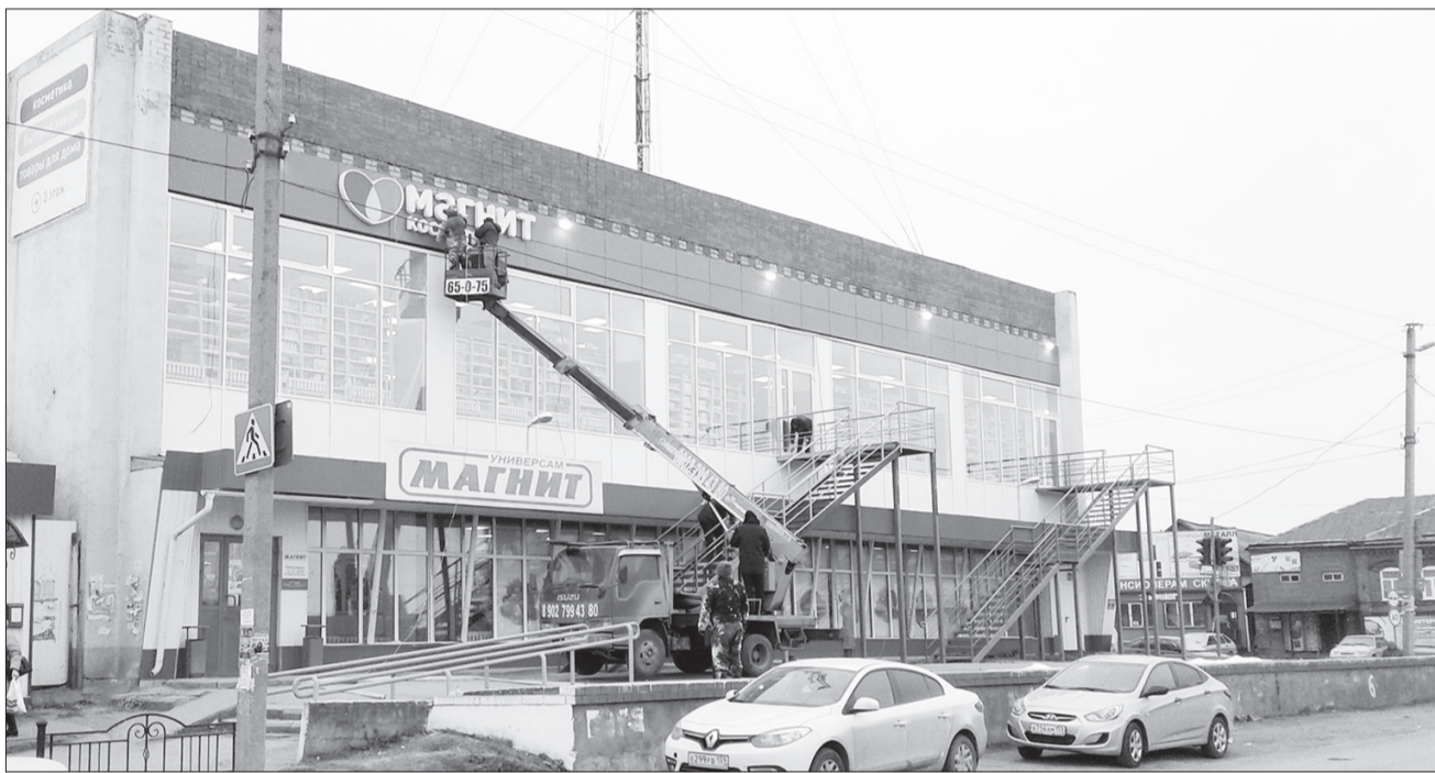
Рабочие резали металл, вели сварку, несмотря на то, что рядом постоянно шли прохожие.

| РЕКЛАМА В ГАЗЕТЕ: 2-01-58 | E-MAIL: ORDA-GAZETA@MAIL.RU | WWW. ORDA-GAZETA.RU