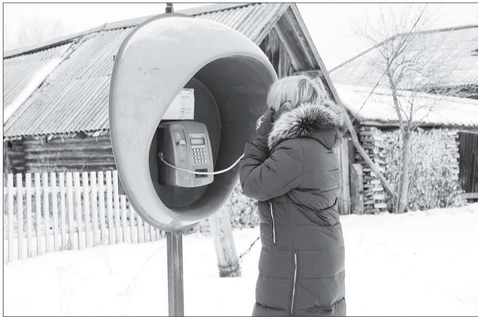
В Ординском районе 46 таксофонов. В Красном Ясыле, например, аппарат находится у здания сельской администрации, в деревне Сходская на пересечении двух улиц - Пушкина и Школьной.

Гостил в праздничные дни у родителей. Мама отправила в магазин, перечислив, какие купить продукты. Думал, запомню список, но то ли разговоры по пути со знакомыми, то ли последствия новогодних праздников оставили в моей голове лишь хлеб да конфеты к чаю. Как назло, и телефон с собой не взял. Подходя к магазину, вижу таксофон. Синяя полусфера защищает телефонный аппарат от непогоды.